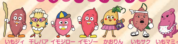
いもジィ 干しハア イモジロー イモゾー かおりん いもサク いもマミィ